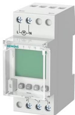
tygodniowy zegar sterujący Profi Digital 24 V 16 A 1-kanalowy 2 DU