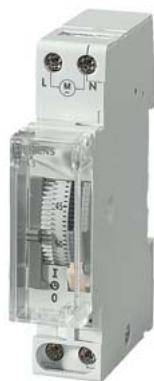
zegar sterujący synchroniczny dzienny 1 NO 230 V/50 Hz 1 DU