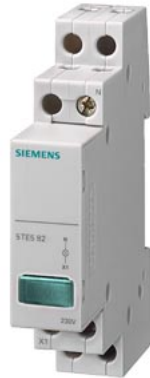
lampka sygnalizacyjna 1x LED, 230 V zielona LED niewymienna