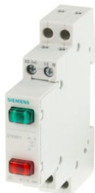
lampka sygnalizacyjna / fazowa 2x LED, 12..60 V czerwony / zielony