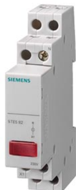
lampka sygnalizacyjna 1x LED, 230 V czerwony, LED niewymienna