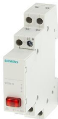
lampka sygnalizacyjna 1x LED, 230 V czerwone do długich przewodów