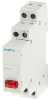
lampka sygnalizacyjna / fazowa 1x LED, 12..60 V czerwony