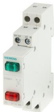
lampka sygnalizacyjna 2x LED, 230 V czerwony zielony