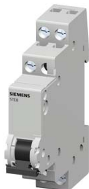
łącznik schodowy 20 A 1 CO