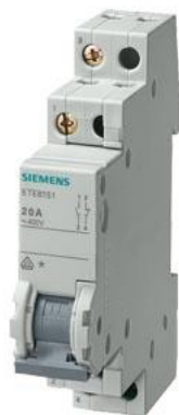
łącznik schodowy 20 A 2 NO 2 NC