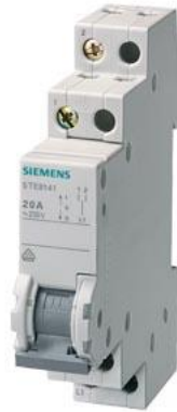
przełącznik grupowy 20 A 2 grupy