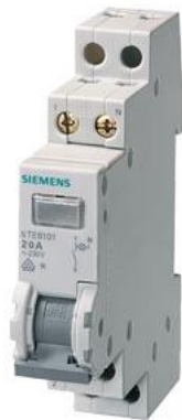
wyłącznik kontrolny 20 A 3 NO 1 lampka 230 V