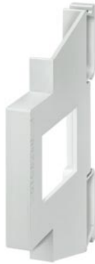
element dystansowy 0,5 DU