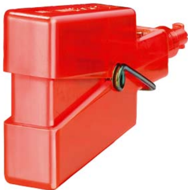
klucz do wkładek pasowanych NEOZED