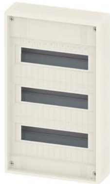
SIMBOX XL natynkowa, bez drzwi 3 rzędy 3x 12 DU (14 DU) klasa ochrony 2