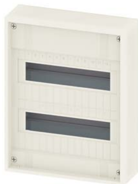
SIMBOX XL natynkowa, bez drzwi 2 rzędy 2x 12 DU (14 DU) klasa ochrony 2