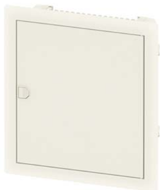
SIMBOX XL podtynkowa 1 rząd 1x 12 DU (14 DU) klasa ochrony 2