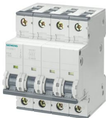
przycisk zwalniający DC DC 1000 V, 63 A