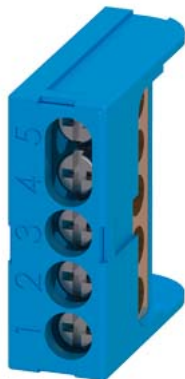
zacisk FI N=3x 16 mm 2 i 2x10 mm 2