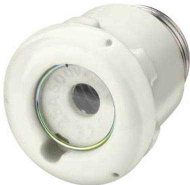
główka bezpiecznikowa DIAZED DII 25 A AC DC 500 V ceramika z otworem do testów