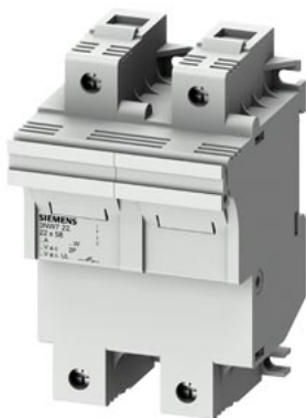
SENTRON, uchwyt bezpiecznika cylindrycznego, 22x58 mm, 2-bieg., In: 100 A, Un AC: 690 V