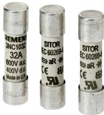
SITOR bezpiecznik cylindryczny, 10x38 mm, 32 A, aR, Un AC: 600 V