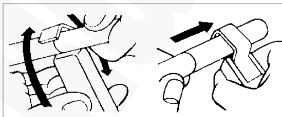
Zdejmowanie izolacji z „konca” kabla