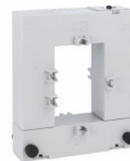
Przekładniki prądowe DM1TA0250