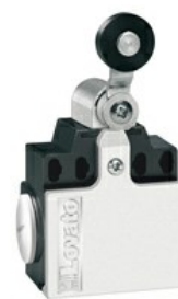
Dźwignia uchylna z rolką KCE