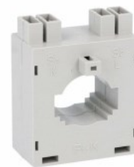
Przekładniki prądowe DM2T0250