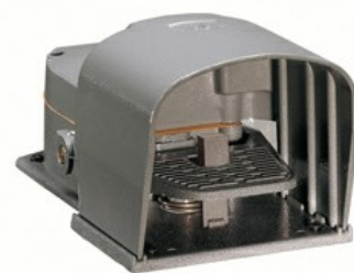
Wyłączniki jednopedałowe, z dźwignią bezpieczeństwa, z osłoną KR210