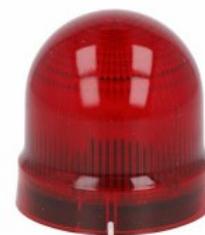
Sygnalizatory optyczne Ø62mm/2,44" 8LB6GL