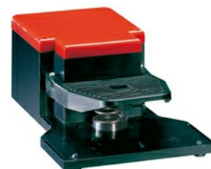
Wyłączniki jednopedałowe, swobodne uruchamianie, bez osłony KG100