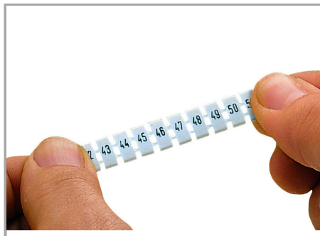
Stretching a WMB marker strip.