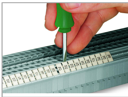
Snapping a marking strip into the marker slot.

Dokonywanie zmian zastrzeżone. Należy stosować się do dokumentacji technicznej produktów.