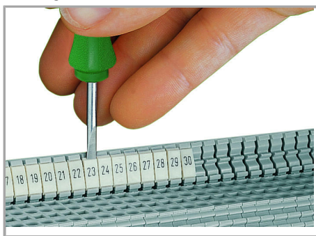
Snapping a WMB marker strip into the marker slot of the double marker carrier.