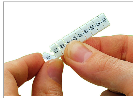
Separating an individual marker from the WMB marker strip – for larger terminal blocks.

Dokonywanie zmian zastrzeżone. Należy stosować się do dokumentacji technicznej produktów.