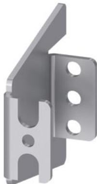
ALPHA DIN ALPHA, wspornik belki, do belka montażowa, stal