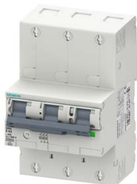
główny wyłącznik nadmiarowo-prądowy (SHU), 3-bieg., E 63, 400 V