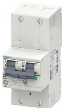
główny wyłącznik nadmiarowo-prądowy (SHU), 2-bieg., E 63, 400 V