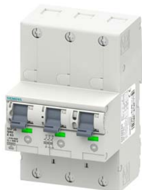
główny wyłącznik nadmiarowo-prądowy (SHU), 3x 1-bieg., E 63, 400 V