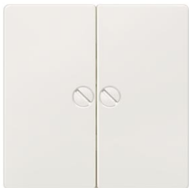
DELTA i-system biały tytanowy klawisz łącznika neutralny 2-krotn. przykręcany 55x55mm