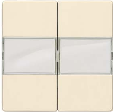
DELTA i-system biały kremowy klawisz łącznika 2-krotn. z polem tekstowym 55x55mm