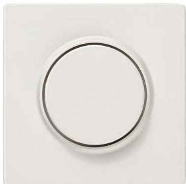
DELTA style biały tytanowy płyta osłonowa do ściemniacza z pokrętkiem 68x68mm