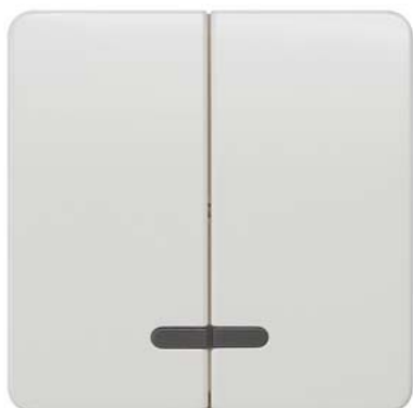
DELTA profil biały tytanowy klawisz łącznika 2-krotn. z okienkiem 65x65mm