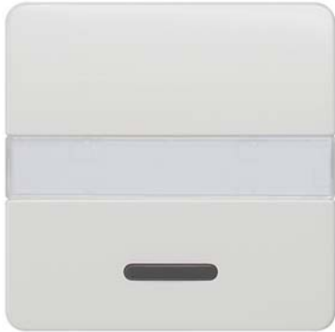
DELTA profil biały tytanowy klawisz łącznika z polem tekstowym i okienkiem 65x65mm