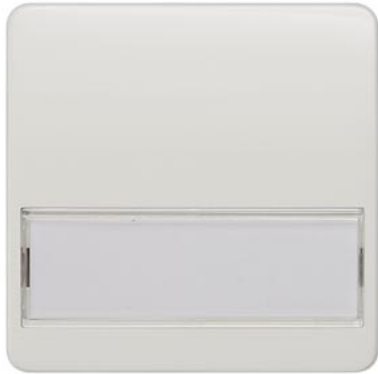
DELTA profil biały tytanowy klawisz łącznika z polem tekstowym 65x65mm