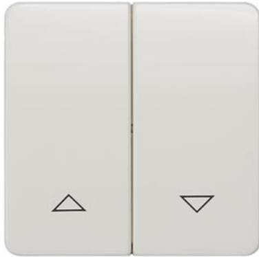
DELTA profil biały tytanowy klawisz łącznika 2-krotn. symbol w górę/w dół 65x65mm