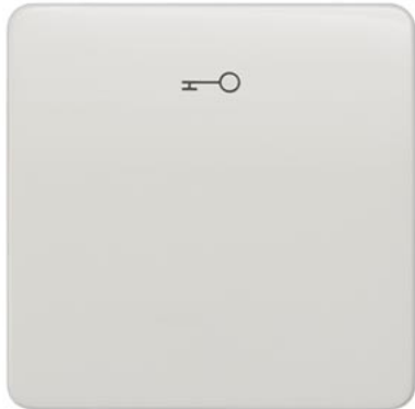
DELTA profil biały tytanowy klawisz łącznika z symbolem otwierania drzwi 65x65mm