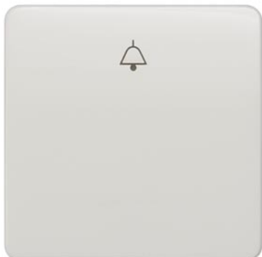
DELTA profil biały tytanowy klawisz łącznika z symbolem dzwonka 65x65mm