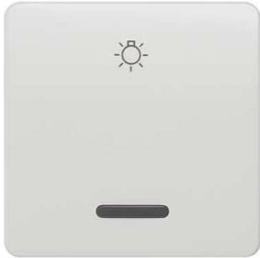
DELTA profil biały tytanowy klawisz łącznika z okienkiem i symbolem światła 65x65mm