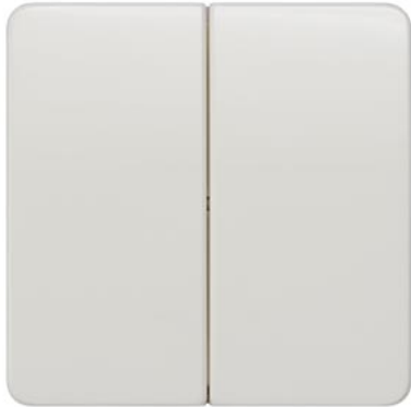
DELTA profil biały tytanowy klawisz łącznika 2-krotn. neutralny 65x65mm