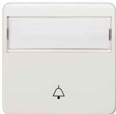
DELTA profil biały tytanowy klawisz łącznika z polem tekstowym i dzwonkiem 65x65mm