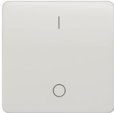
DELTA profil biały tytanowy klawisz łącznika z symbolem I/O 65x65mm