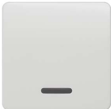
DELTA profil biały tytanowy klawisz łącznika z okienkiem 65x65mm