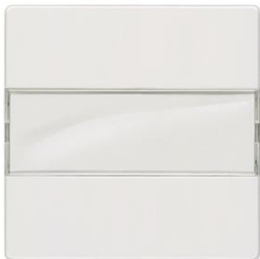
DELTA i-system biały tytanowy klawisz łącznika z polem tekstowym 55x55mm