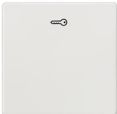
DELTA i-system biały tytanowy klawisz łącznika z symbolem otwierania drzwi 55x55mm